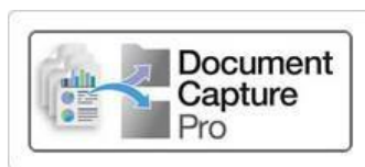
Document Capture Pro